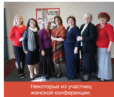
Некоторые из участниц женской конференции.