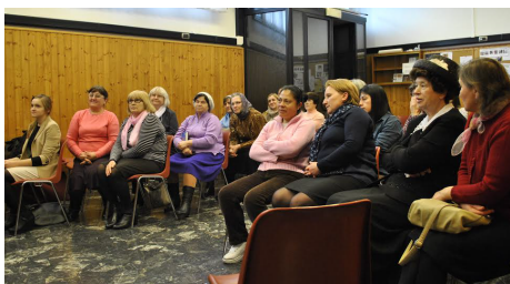
Во время общения группы верующих иммигрантов из Украины в Милане.