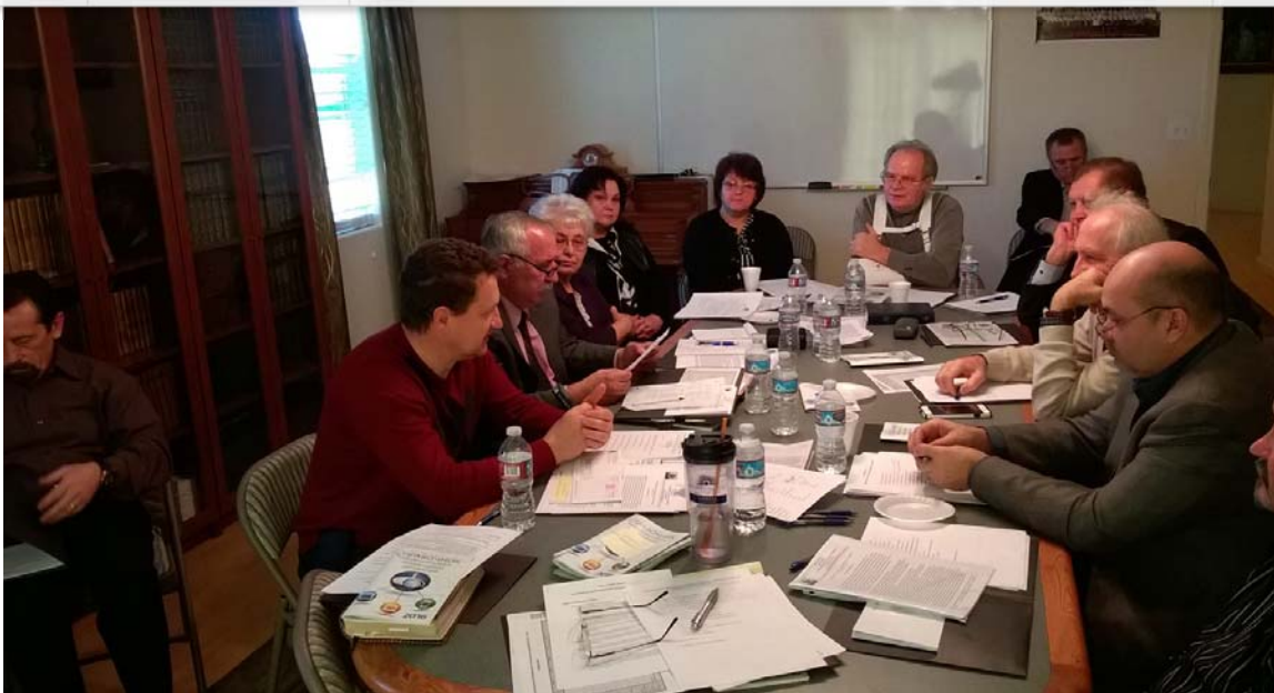
Во время встречи руководителей отделов