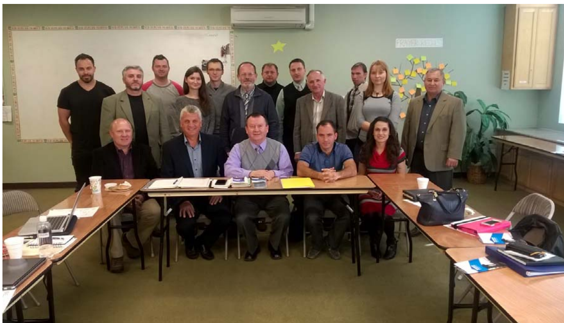
Совместная встреча сотрудников отдела и представителей миссионерских отделов церквей