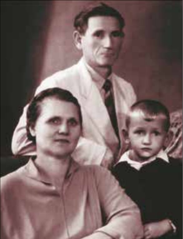
Сын Витя с папой и мамой, фото 1960 г.

стране, отвергшей Бога, гнавшей Его последователей и мечтавшей без Него соорудить на земле рай. Подобное желание диагностировал еще царь Давид: «Сказал безумец в сердце своем: «нет Бога»...» (Пс.13:1).