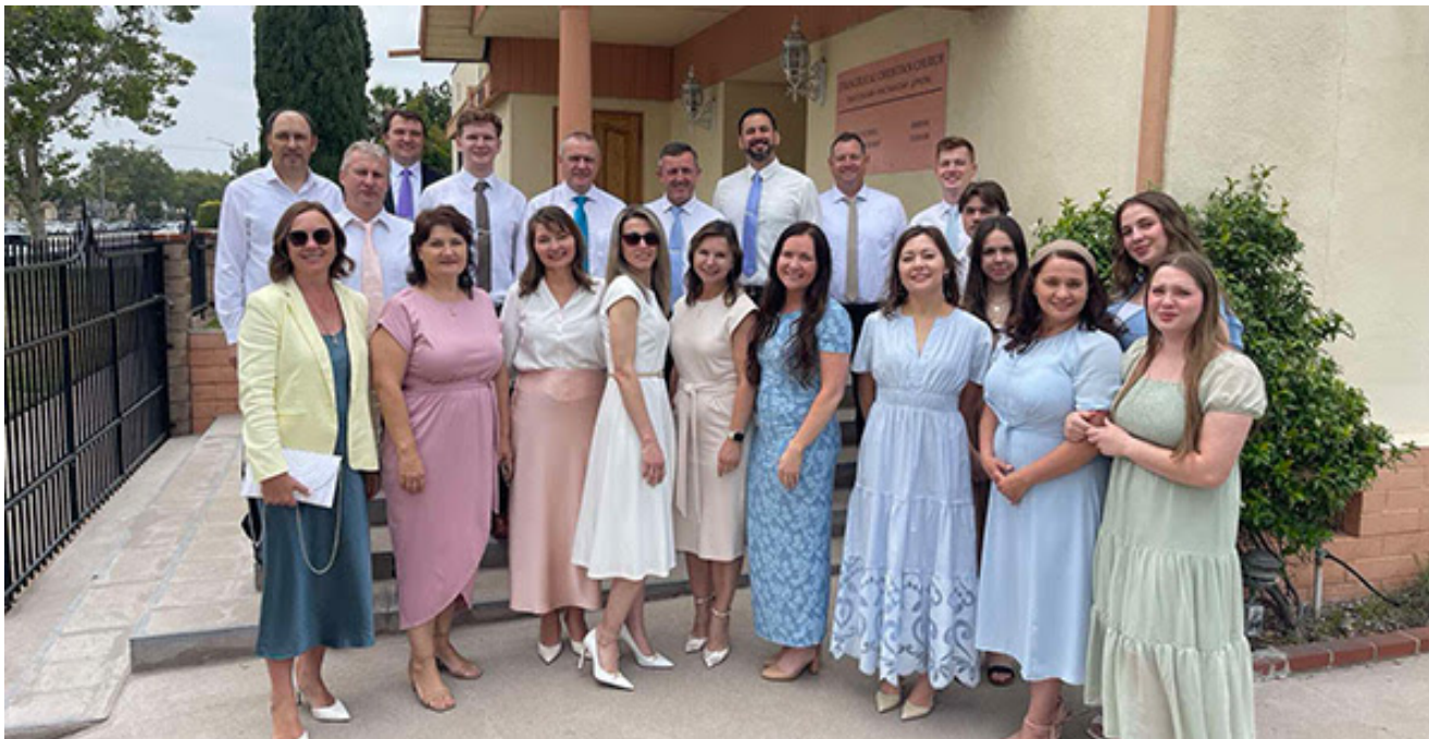
Хор «Кредо» в церкви Монтебелло